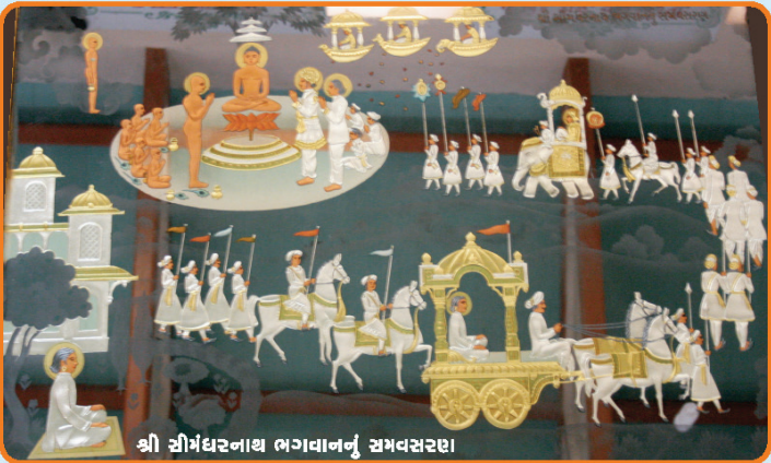
શ્રી સીમંધરનાથ ભગવાનનું સમવસરણ