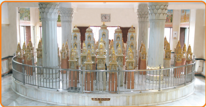
श्री अश्वमेध भगवान दिगंबर जिन मंदिर मलासना उपरना कक्षमां श्री पंचमेरु नंदीश्वर जिनालय