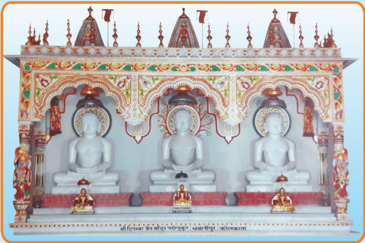
श्री दिगंबर जिन मंदिर पदोपकुर - भवानीपुर (कोलकाता)